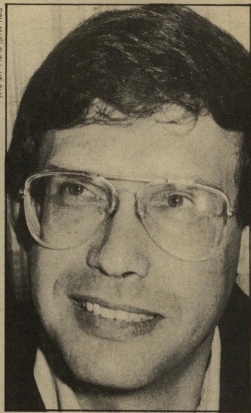
משה איתן, משרד הביטחון