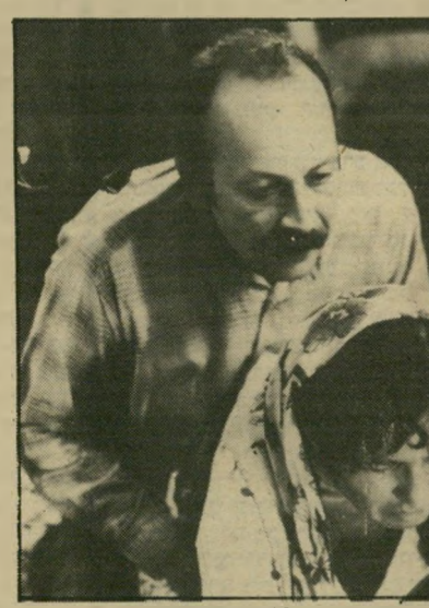
40 מילא פרני

בין השחקנים שהוכיחו כי לא נס ליחם, גם אם לא היה מוזק אילו ניסו לגוון קצת את תפקידיהם, אפשר לציין את הופעתו השטנית של ג'ק ניקולסון כמכשפות מאיסטוויק. מישל בלאן הבריק כהטרוסקוסטאל היופך למרות רצונו להומוסקוטאל, רק כדי לגלות שמיין הוא אמצעי ולא מטרה, בחליפת ערב. אנדרה דוסוליה עשה רושם נעו תפקיד הכנר המתאהב באשת ירדו במלן. קיולאס קייג' הצדיק שוב את כל התיקויות שתלו בו בבייבי ארוונה. וויטוריו גאסמן היה מושלם, כרגיל, בהמשפחה. אולם השחקן שהרשים יותר מכל, אולי משום שלא שחקן אלא את התפקיד שלו מול המצלמה אחרי שחי אותו