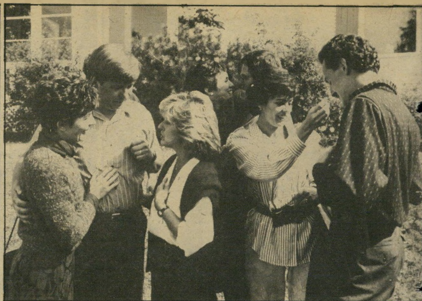
3. שיחות מלוכלכות (קנדה)