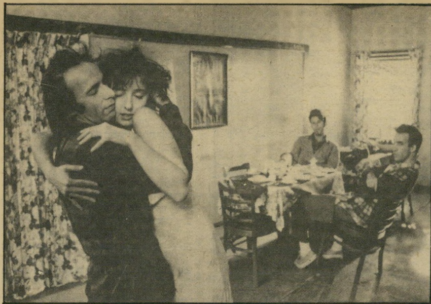
4. נרדפי החוק (ארצות-הברית)