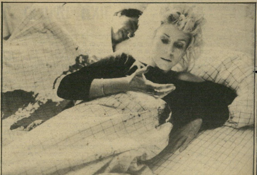
3. הבוקר שאחרי (ארצות-הברית)