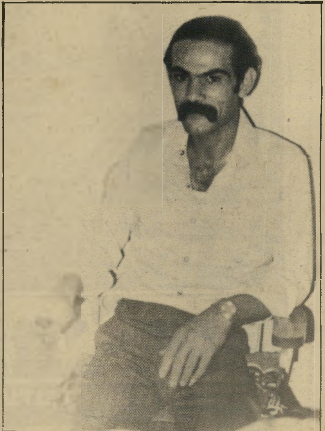
נעלם עלי עפג'ני