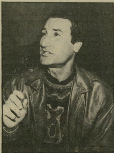
טל ברודי — הקטע הטראומתי

לפני שנים נפררו שחקן-הכדורסל ואיש הביטוח טל ברודי ואשתו רוננית. הסיבה לפרידה היתה הקשר המיוחד שנוצר בין שחקן הכדורסל ג'ק צימרמן לרוננית.