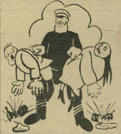
רישום של מאיאקובסקי: "הקץ למשקאות תוצרת בית" במסיגרת מסע נגד האלכוהוליסטים