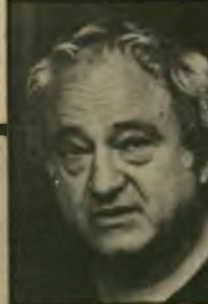
אומר השרגנר שרון: ולא ייתכן משאומתן עם שופך דם-יהודים. מנהיג אש"ף יאסר ערפאת.

מה קרה פיתאום? להשיג משהו. יש קשר ישיר בין התפתחות זו ובין המאורעות שבהם היה מעורב אישהגנה תשמ"ז. פרשת איראן/קונטרס עירערה את מנהיגותו של רגן ואת אמינותו בעיני עמו. מדיניותו הלאומנית פשטה את הרגל. היעד החביב עליו ביותר,