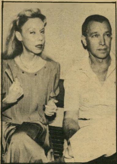
ליז ודורעם הרדי רומאן עם בחור נרוש

האבא שאול איוונברג — נוסע בעולם לרגל עסקיו. נפגש עם כל ילדיו, ונותן להם תרומות קטנות של כמה עשרות אלפי דולארים בכל חודש. עם אסתר הוא ניתק את היחסים, אבל