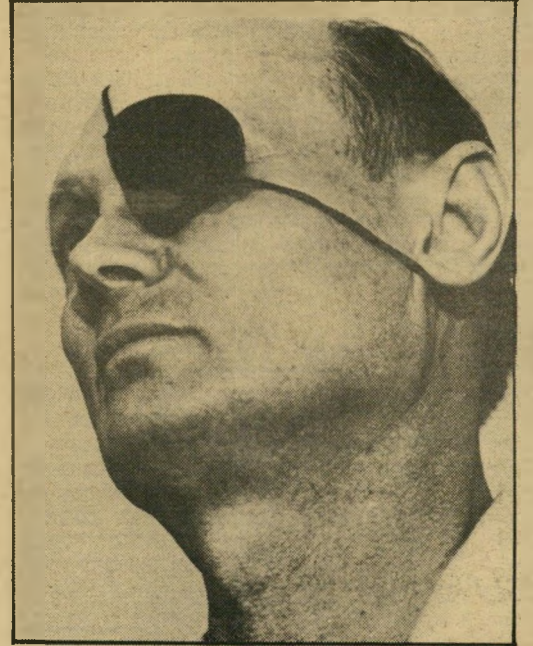
משה דיין, רטייה בעין שמאל: הרס עצמי?

בימים ההם ראה אותו הציבור לא־אחת על הי מירקע, כשהוא בלתי־מגולח, לבוש בסרבל של שר־יונאי ועונד דרגות של סרן. הוא הסביר את הקרבות על פני המפה, כאחד המפקדים הבכירים.