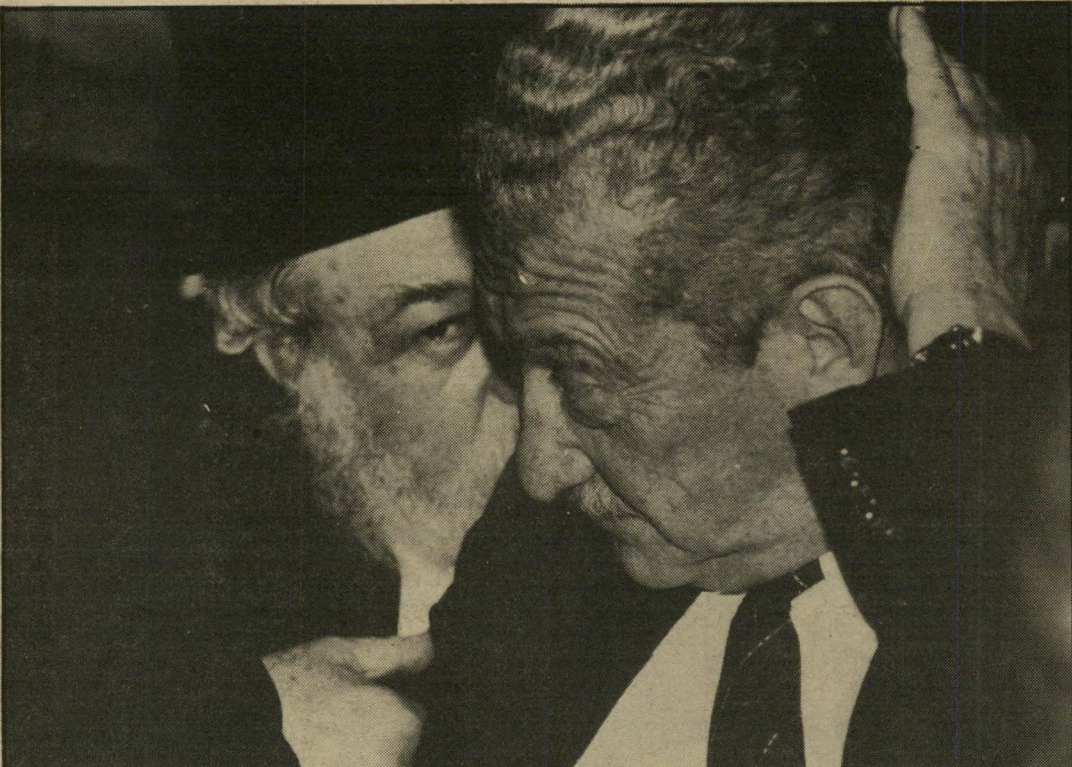
עזר וייצמן ואברהם שפירא: אם תודח ההנהגה הוותיקה, מי יכול למלא את החלל?

בעיני הצופה השיטחי, היתה השנה סדרה אינסופית של משברים פוליטיים, התכתשויות, התנצחויות, השמצות הרדיות של פוליטיקאים, קנוניות ומוזמות. אך כל אלה לא היו אלא כקצף על פני המים. הם היסו את המציאות הבסיסית: לא היה הבדל של ממש בין הכוחות הפוליטיים העיקריים. "האחדות הלאומית" לא יכלה להתקיים אלמלא היתה מונחת