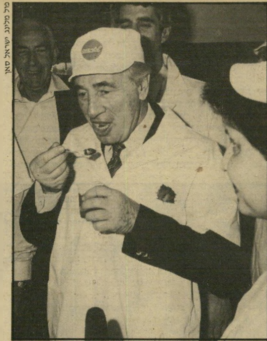
פרס במיפלת-מערנים: הוא לא ליקק רבע

מאת הפתיע ניסים את הציבור. במהלך כל שנת תשמ"ו עלתה קרנו בהתמדה, כשהוא רוחש לעצמו את אהדתם של אנשי האוצר, הכלכלנים המיקצועיים וחבריו בממשלה. ניסים לא התיימר להיות גאון הור, ומיעט בגינונים אישיים.