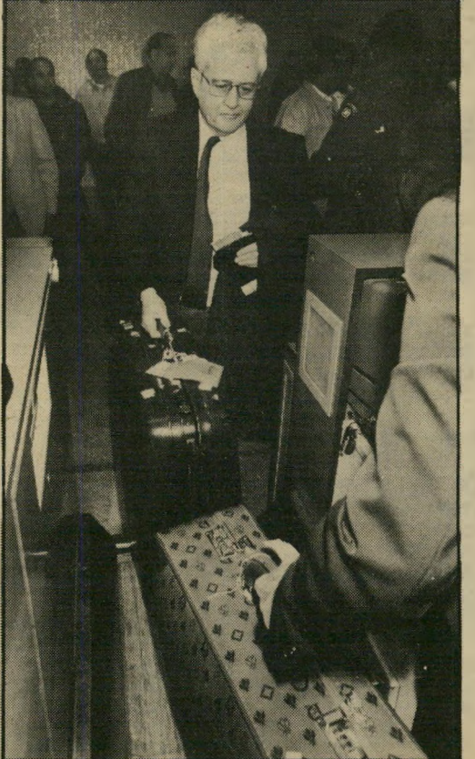
יפת בנמלי-התעופה לוד: בריחת המיליונים