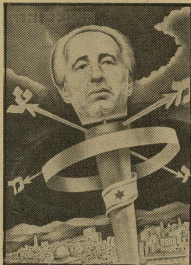
איש השנה תשמ"ה ראש-ממשלה פרס