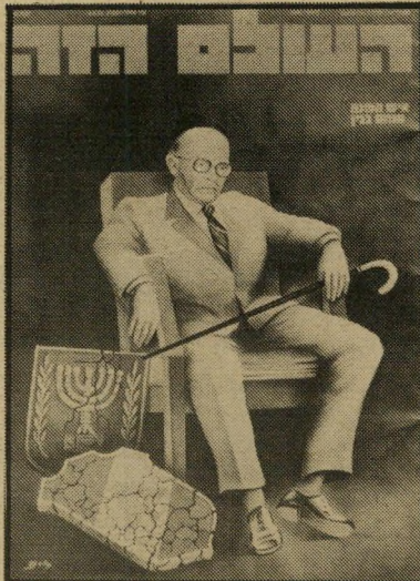
איש השנה תשמ"ג פורש בנין