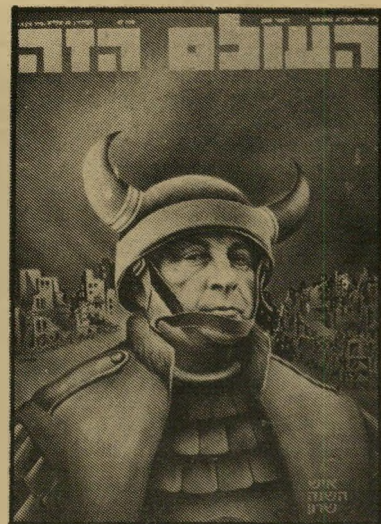
איש השנה תשמ"ב פולש-ללבנון שרון