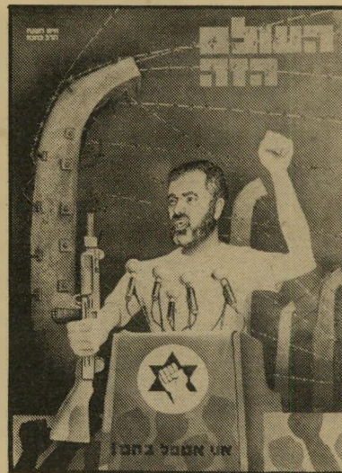
איש השנה תשמ"ד פאטיס כהוא