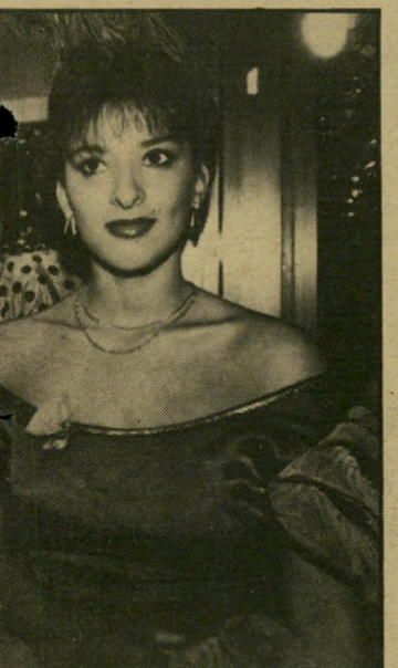
יפה אלפרסון ונלית ורטהיי תחושה של והבנות סבלו מכך. כשהוצע להן לפשוט