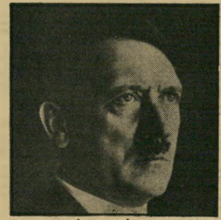
אדולף היטלר הנייר היה חדש מדי

הובאו לבדיקתו עליידי סאודי-טייס. גם כאן ברק את הנייר, ומאחר שהוא עצמו עבר ב-1935 באיטליה, כאשר