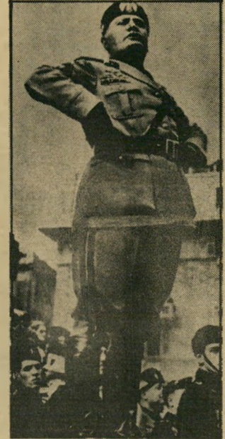
בניטו מוסולוני הנייר היה מקע

כימאי. בנעוריו עבר בבתי-חרושת לנייר ושם התמחה ככל סוגי הנייר והרכיו. הוא התעניין במיוחד בניתוח מדעי של ראיות מישפטיות, והתחיל להתמחות בכך. כיום הוא אחד המומחים הפרטיים הגדולים באנגליה לנייר, סיבים, צבע וטכניקות-אצבע. יש לו מעבדות משוכללות בלונדון, הנותנות שרות לעורכי-דין ולמוסיאון-נים בכל העניינים של בדיקה מדעית של חומרים.