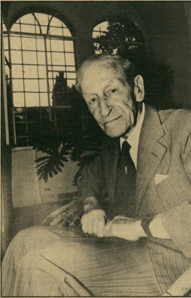
מומחה גראנט התכריכים של פרעה

אחרי המפלה הצורבת שהנחילו שתי העדות המומחיות לסניגוריה במישפטו של ג'ון איוואן דמיאניוק, החליטו הסניגורים לתקן את המעוות. עורך-הדין יורם שפטל ביקש לברר מיהו המומחה שחשף את