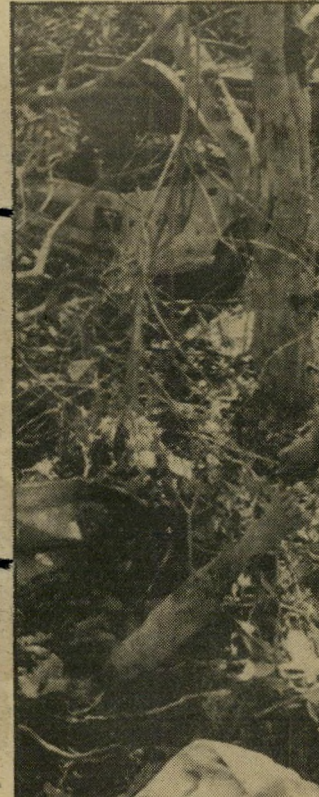
התצלום של איי-פי: רגל של גופה קיפוח-נפש דוחה שבת

● גופים ישראליים הדוגלים בשלום ישראל-פלסטיני. (המשך בעמוד 8)