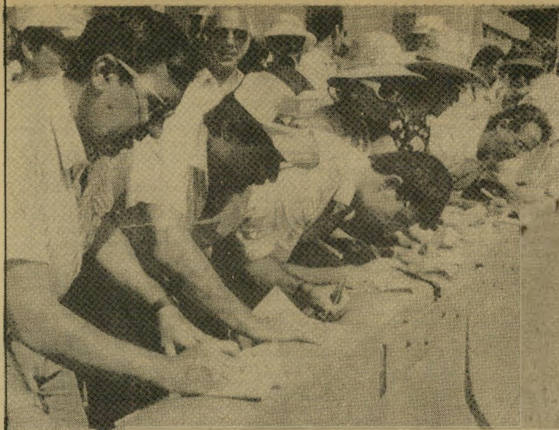
About 800 aircraft workers gathered outside the U.S. and Canadian embassies in Tel Aviv on Wednesday to protest the decision to scrap the Lavi. Many filled out forms for immigration visas to dramatize a threat to at least 3,000 jobs posed by the cancellation.

By Seth New York MANILA — President Cora agreed Wednesday isolation raising U pine soldiers aft from her chief of dress the grievan military. The chief of st V. Ramos, said th promised to seek itary from other necessary, follow last week. "We are very said General Ram pressure to dem itary grievances means short of re The president's doro Benigno, co and said the pres vent a group of private-sector lea itary grievances. But in an indi