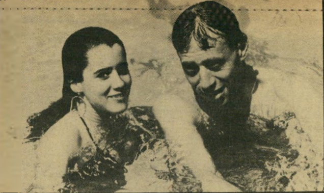
לפני אז אונ' —

היפה והמעניין הזה, הוציאה חברת הליקון עוד תקליט של הרב, תקליט-אוסף ישן, כדאי לשמוע.