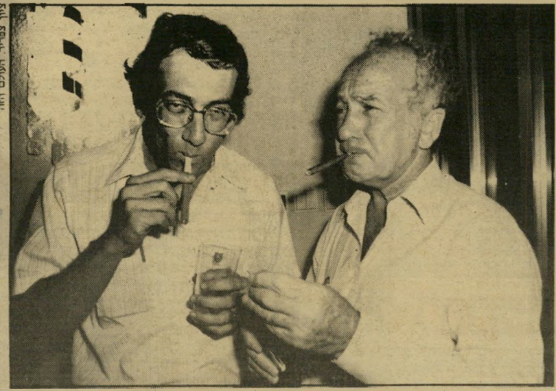
מלונאי חיים שיף ויודיר (חי-כיליבור אהוד אולמרט) הוא כן שילים

תבש בעת פירסומו בהעולם הזה (מיכתבים", העולם הזה 26.8.87). התפלאתי מאוד לראות שמשום מה קיצר העולם הזה את חייו של שירי ושורתו האחרונה הושמטה ובכך הוצא כל העוקץ שלו והוא נשאר עירום ובלתי-גמור.