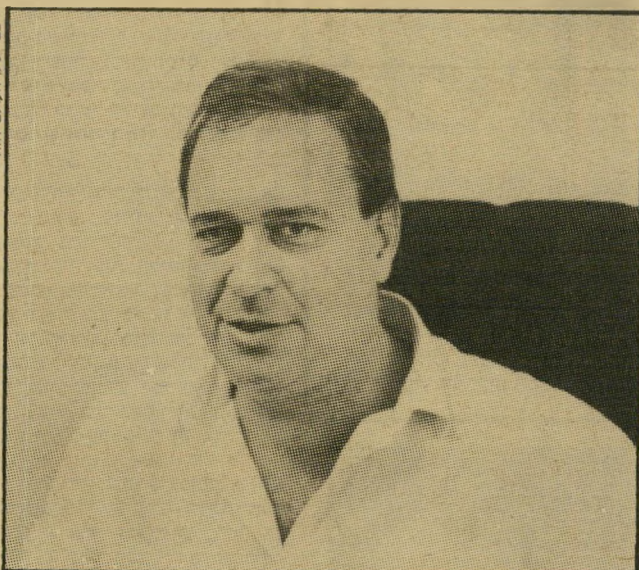
סוחר אפרתי מעצר בדרך לנביית העמלה