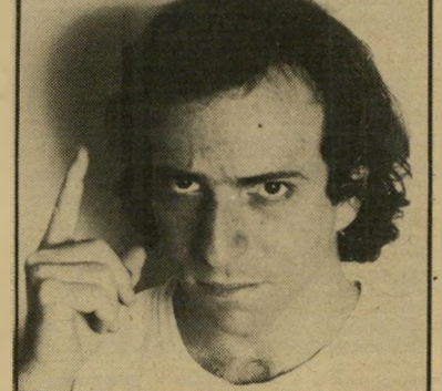
סנדרסון כן־אדם זה כן־אדם

חיות־מחמר, הסכתא שלי. כן־אדם זה כן־אדם וכלב זה כלב. במיוחד אם