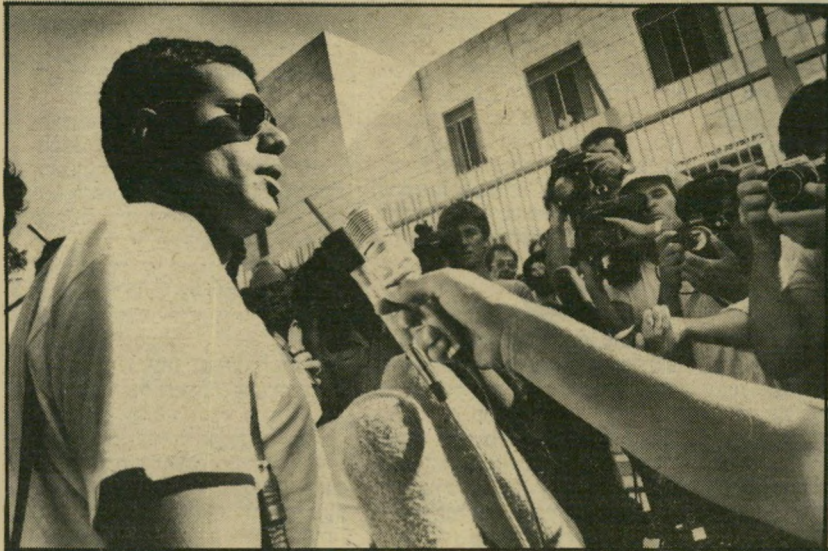
אח אשר ועונו מתראיין, הוא לא הסכים שנושמור עליו

שרה ליבוביץ (המשך בעמוד 38)