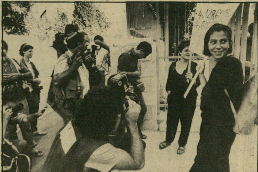
אנרכיסטית מר והשלט, לא רק אתה עובד כאן