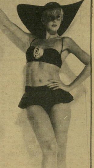
ציון צפתי, העולם הזה

האתגר הגדול היה איך להפוך את הקולקציה של תחרת ירושלים לקר' לקציה מעניינת. הקולקציה, שהיתה