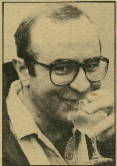
שחקן הופקינס סיפורי הסבתא הצוענית

*** נרדפי החוק (לב, ארצות-הברית): שלושה עלוכי חיים מורנניים באמריקה המ