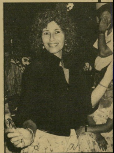
אחי מור אמה של רויטל, חננה אח יום הדין לדהה ה־40, לכשה את ביגדי בתה והוכיחה שהיא עדיין יפה וחטובה.