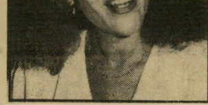
אשת-ישר נבון ומחלת סרטן

חמישה ספרי ביוגרפיה עומדים לר"אות אור בקרבו, וחלקם בוראי יעוררו מחלוקות. ● יצחק מודעי שוקר על השל"מת ספר שיתאר את ימיו במשרדי ה"ממשלה ובמפלגה הליברלית. ● בנימין זיגל ומשלים ספר על ימיו בממשלה, לקראת מעבר לקריית רה אקדמית. ● אברשה טמיר משלים ספר על ימיו במשרד הביטחון, תחת כמה