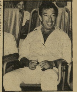
מגישה טימור קונצרט חינוך

הפרוייקט המיוחד של מישור הביטחון, שבו מאלפים קופים כדי שישימו סיוע לנכים, היה אמור להגיע ליריעת הציבור רק בעוד חודש ויותר. צוות של התוכנית תצפית בטלוויזיה זיה עקב אחרי הפרוייקט וצילם את הקופים. השידור היה מיועד לחודש ספטמבר, ונחמה למועד מאוחר יותר, בחודש אוקטובר, בגלל התגים. בריחתה של הקופה עיזה — או דני,