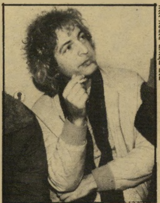
זמר חנוך עוד קונצרט חינוך

הבאים בתור הם שניים גדולים, האחד אמריקאי: כוב רילן, שאיתו נמצאים אנשי התחנה במשאומתו, מתוך תיקווה לקבל את הסכמתו לשידור הקונצרט שלו. הרעיון הוא