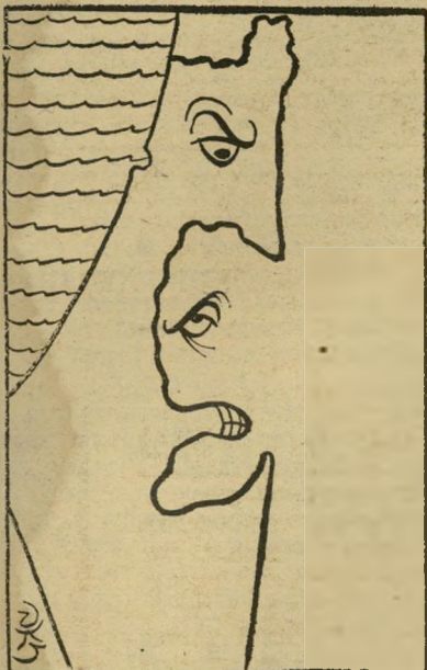
זאב ב.הארין 1980

עוד על עיצוב אופנה בהשראה סיפ-רותית ("ספרות בדיונית", העולם הזה 5.8.87).