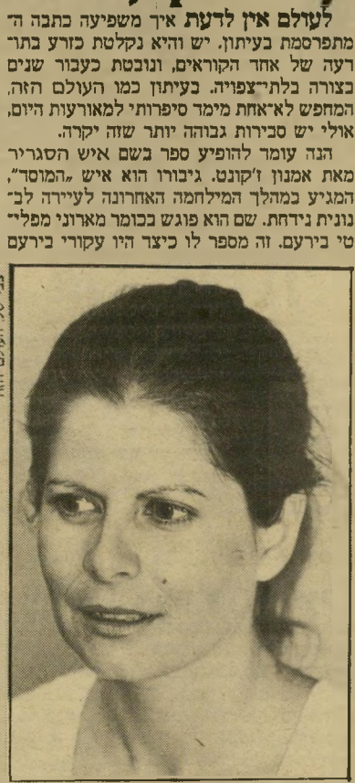
עיתונאית אסולין הרפתקה עיתונאית

נרמה לי שיהיה זה מן ההגינות לקבוע עובדות אלה.