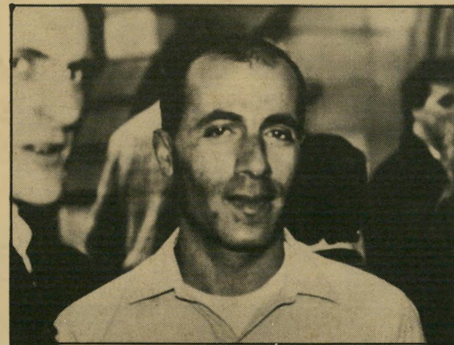
נושא לסרטים וענונו עזרן סירב

שני הצוותים פנו לחנן עזרן, כתב הטלוויזיה הישראלית. עזרן עשה כד מנו כתבה על וענונו שבה הביא