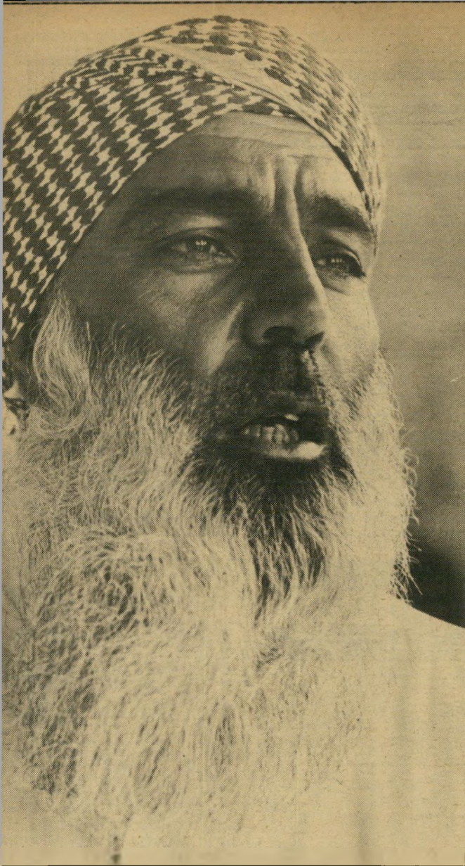
ציון צפורה העולם הזה