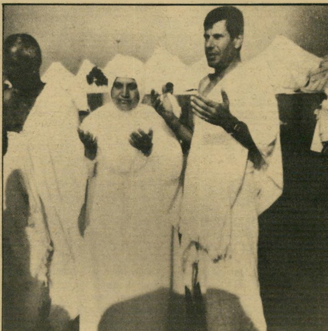
ג'אבר ואשתו באתרי העליה-לרגל האשה הפילה את הוולד, אבל היה כדאי

גם כך היו מחצית הנוסעים דתיים-קיצוניים. הטוענים כי כל מוסלמי צריך לנסוע למכה, זו אחת מחמש מיצוות-היסוד של הדת: תפילה, צום, מתן-צדקה, האמונה באל אחד ובמוח"מד נביאו, והנסיעה למכה. למי שיש די כסף לנסיעה ולטיפוק צרכי הבית ■ שרה ליבוביץ