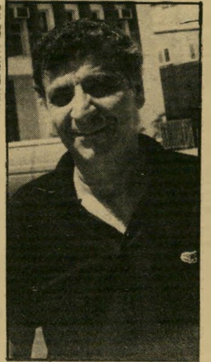
מזכיר זכות. אני לא פחד!

שוב אני מקבל טלפונים רבים שמאיימים שישרפו את ביתי על כל יושביו, או שיחטלו אותי. המאיימים גם באים בקבוצות לבניין מועצת-הפועל'ים, ובכל מיפגש כזה הם מאיימים עליי כי ישרפו את הבניין עם כל