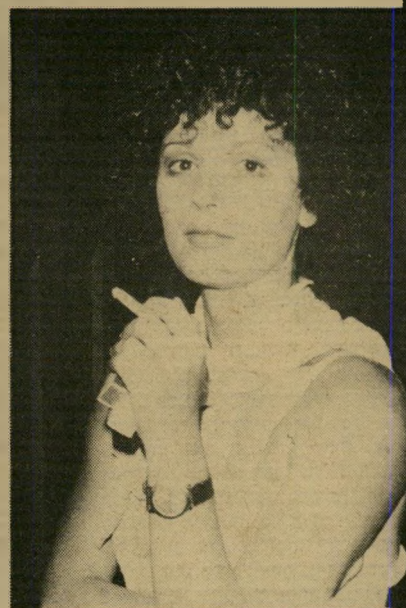
שחקנית ריבלין אולפן משוחזר

סצינה נוספת בסרט מתרחשת באולפן טל-וויזיה. חיים יבין , מנהל הטלוויזיה, נתן אישור למפיקי הסרט לצלם את הסצינה באולפן הטלוויזיה בקריה בתל-אביב.