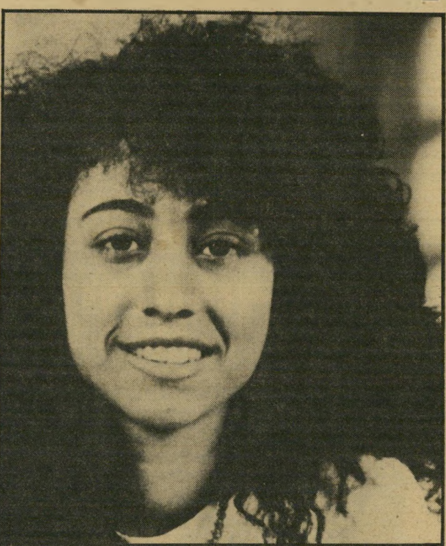
קורבן חבושי מוות למען היופי

נתיחת הגופה, שנערכה במכוון ה' פאתולוגי, לא גילתה את סיבת המוות. משום כך עורכים כעת בדיקות מקי'