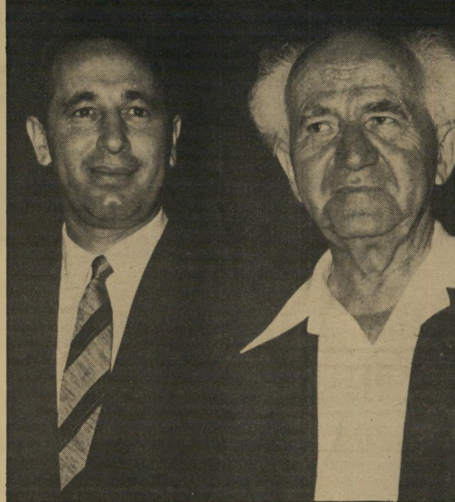
בן-גוריון ופרס (1960) אל תיגע בארבע אמותיו של איש זה!"

יודע שכך-גוריון לא דגל בשום אופן ופנים במדינה קטנה. "פרס יכול לומר את דעתו, אבל לא להשתמש בכך-גוריון, זהו שקר! אם אני - מוותיקי מיפלת-העבודה - לא אני, אז מי יניב אילו הייתי