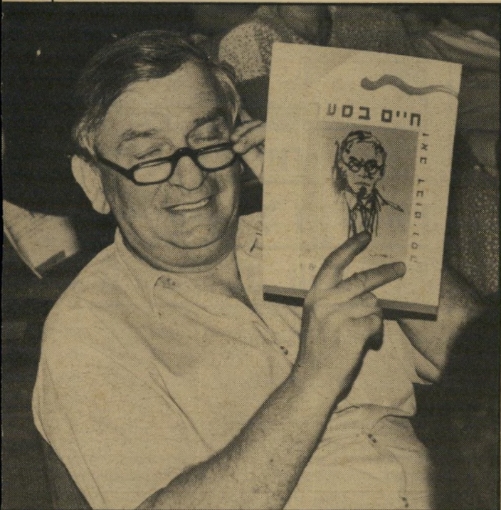
רחל אבנרי, העולם הזה

אריאל שרון עמד דום כאשר שרו את שיר-בית"ר בהקרנת הסרט התיעודי על זאב ז'בוטינסקי, חיים בסער. רק בתצלום ניתן לראות שאריק, אשר גדל בארץ-ישראל העובב-דת, אינו מכיר את מילות השיר הבית"רי, וכך גם לילי אשתו. לכן הם לא שרו. לעומת זאת נראה מנחם סבידור, חובב-השירה הידוע, שר את השיר בהתלהבות (מימין). וגם יצחק שמיר ואשתו שולמית שרים.