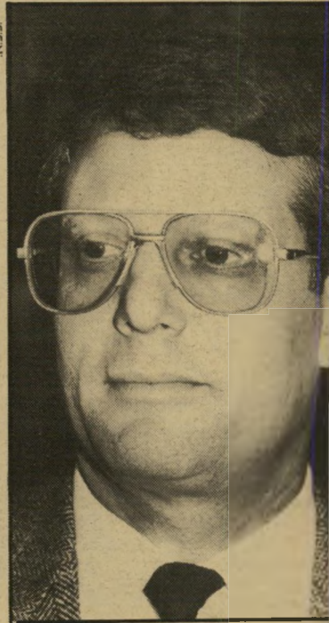
סניגור קרייטר. תשמע, חמוד, אתה הרגת אותו!

מיכל נטרה להקליט את גיתית, אבל זו לא הודתה באשמתה, אלא להריפך, הכריזה על הפותה. החוקרים לא