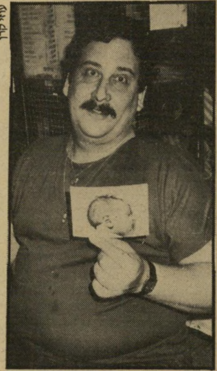
איש-כסית ותמונת בתו האם היה צריך למותו

החולים איכילוב, מתייחס לשעה-הרשומה על תעודת חדרהמיון כשעת-ההגעה לבית-החולים. "איש-כסית הגיע בכוחות עצמו, נרשם כאשנב הקבלה ומייד נבדק על-ידי רופאה. היא מצאה שהוא במצב-גופני טוב, בהכרה, משתף-פעולה. הוא סיפר על כאבים בחזה, מלווים בחוזה, הנמשכים מזה שעתיים וחצי. הרופאה גם ראתה שהוא מאוד שמן, עוברה-שכרדי-כלל אינה מעירה על בריאות-טובה.