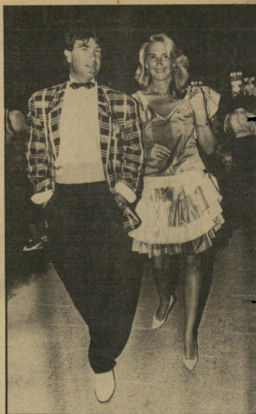
אטלס ריצ'ארד הפאריסאית לב-שה שימלת-מיני משובצת מטאפט, עם מיקבצות, בעלת מותן נמוכה, שעוצבה על-ידי גי לארוש. ונראתה מאוד אופנתית.

אצל הצעירות הישראליות ניתן היה לראות שמלות שחשפו פה ושם חלקי גוף שונים. חלקן היו לבושות בחוסר-טעם, מבלי להתחשב בממדי גופן, או מבלי ליצור מראה כולל, שבו כל הפרטים שייכים אחר לשני, או תוך שימוש כבדים זולים, שאי-אפשר היה להסתיר את איכותם הירודה. לעומתן נראו גם צעירות, אשר התחשבו כמוגד-האוויר החם, תוך שהן מציגות את המילה האחרונה באופנה: שמלות קצרות, צמודות לגוף וחושפות רגליים חטובות.