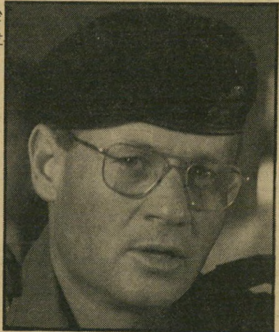
אלוף יתום חמישה בנים

נתמנה ♦ כראש אגף תכנון (אג"ח) במטה הכללי של צה"ל, אלוף דני יתום , 42 יתום, יליד נתניה, אב לחמישה בנים ובעל עיסורי המופת, נחשב לקצין קשוח וקפדן במיוחד (המקפיד גם עם עצמו ורץ מדי יום מיספר קילומטרים לשם שמירה על כושרו הגופני), שביקש בנעוריו ללמוד רפואה, והעדיף, בסופו של דבר, את השירות בצבא הקבע (במסגרתו הספיק לסיים לימודי פסיקה, מתמטיקה ומרעיי המחשב) ובו שימש עד לאחרונה כמפקד אוגדה, אחר תקופת שירות של שנים מיספר כמוזכרים