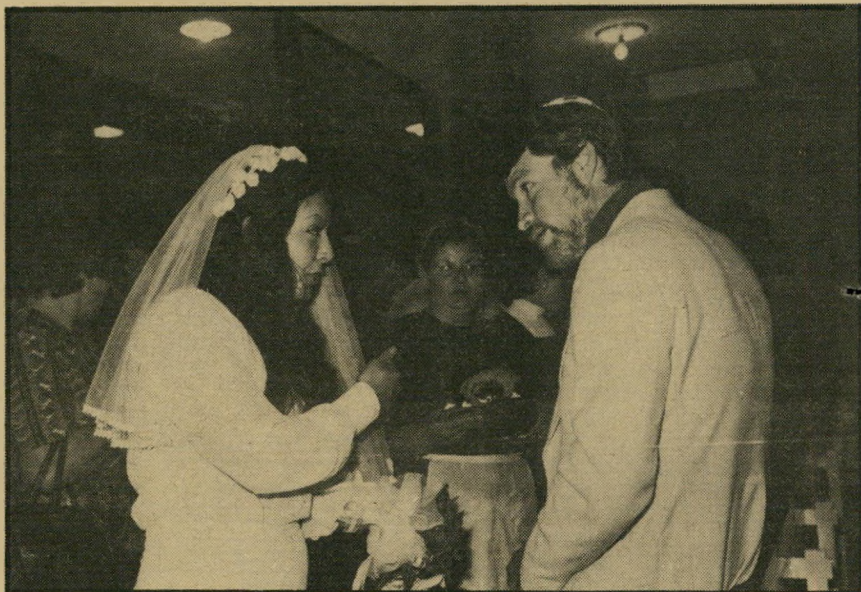
רייטר בהתנות אחד ממטרופולי השימחה גדולה מן התיסכול...

לכן נרקימנים נמצאים בשכיחות גדולה יותר בשכונות, כי הזמינות של הסם גדולה יותר. יש מערכת חברתית מסוימת שבתוכה יש עוד אנשים כאלה וזה חלק מהתמנה גם אם זה לא מקור כל. כשהו נוסף לזמינות ולתחושה של הפחתת הכאב שבאה כתוצאה מזה, הנה הסיפור.