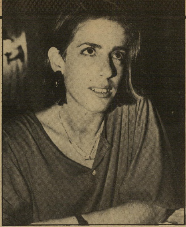
מלצרית קידר. איך אפשר לטעות בו?

הוא קם ויצא מהחדר. אחרי עשר דקות חזר. כנראה באותו עשר דקות נרשם בדלפק-הקבלה. בשעה 7 ורבע הגיעה הרופאה והתחילה לבדוק את החולים. הוא היה השלישי בתור. קודם בדקה שני זקי גים. אחרי-כך הגיעה למשה. היא הי קיפה את מיטתו בוילון. הוא סיפר לה על הכאבים בחזה. היא ביקשה מה-אחות מכשיר אק"ג. המכשיר לא פעל. הרופאה ביקשה ממנו לעבור למיטה אחרת. שם שוב חיברה אותו למכשיר. כשגמרה לבדוק אותו עברה לכי-רוק וקנה. ששכבה סמוך לאחותי. פתאום שמענו נחירות מכיוון המיטה של איש-יכסית. הרופאה מיהרה לעברו, צעקה שיביאו מכשירי-החד-יאה. בחדרהמיון השתררה המולה.