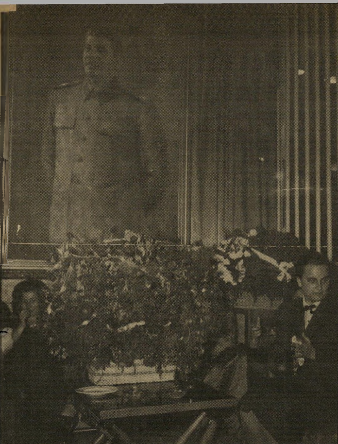
סטאלין בשגרירות הסובייטית ברמת-גן (1966) פעמיים נשק ציכי

יתכן שאין צירוף מסוכן יותר במדי- נת-ישראל מאשר בצירוף של אריאל שרון + רחפור. כאשר שירת שרון בפיקוד הצפון, הוא הפך את רחפור למכשיר מדיני