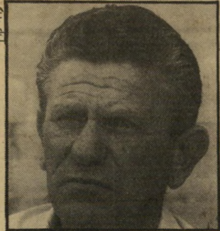
מאמן שניאור ידידות ותיקה —

לידי חתימת הסכם עם אליעזר שפיגל? במיגרשים מספרים, שאת הקשר יצרו חיים צימר, מנהל הפועל תל-אביב, וגיורא שפיגל, מנהל מכבי תל-אביב. השניים, מסתבר, הם חברים טובים כבר הרבה שנים. השבוע ירעו לספר מן קורבים שהיה זה צימר אשר סלל את