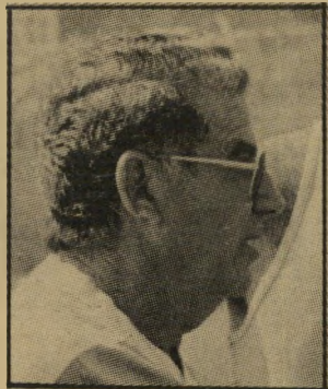
מאמן שפיגל וסיכסוכים חדשים

הדרך לשפיגל-הבן, ויצר לו את הקשרים עם הפועל פתחתיקוה. הקירבה בין השניים הביאה גם את לאמן, כעונה הקרובה, להפועל תל-אביב כיבנערים.