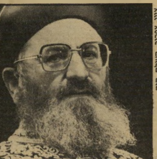
רב הראשי אליהו נשוי בין רווקות

ועבר פטורים מהרבה מיצוות. מברכים את הקב"ה שבחר בנו שנוכל לקיים יותר מיצוות. אין כאן בשום אופן עדי-פומת כל שהיא על פני הנשים.