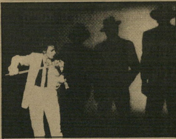
לורי אנדרסון: כל הכישרון הזה

לעזרתה של אנדרסון עומדים מוסיקאים מופלאים, כל אחד אגדה בשיטחו שלו. בראשם אדריאן בילו, הזמר והגיטריסט שגם ביקר בישראל, הידוע כאחד מנגני הגיטרה הגדולים בעולם; ג'וי אסקין, נגנית סקסופון שיש לה להקה משלה; דייוויד ואן-טייגה, מומחה בכלי-הקשה שהקליט גם עם רא"ש שים מדברים, הלהקה שאפשר לראות את התעודות של הופעתה, הפסיקו להיות הגוינויים, בבית-קולנוע אחר, ומעניין להשתוות בין שני הסרטים האלה, מוסיקלית וקולנועית גם יחד; ולבסוף ריצ'ארד לאנדרי, הילן סקסופוניסט וקלרניטן, מייסדי התיזמורת של פיליפ גלאס, שגם הוא נמנה עם נגני