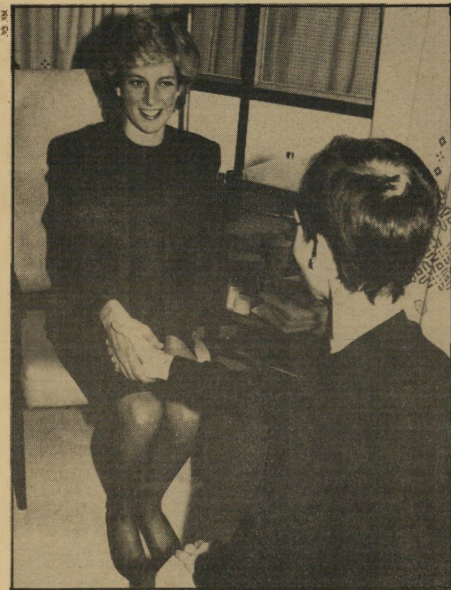
הנסיכה דיאנה לוחצת ידו של חולה-איידס. אני שומר את הפחד לעצמי!