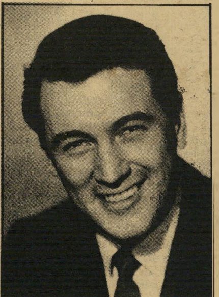
קורבן איידס רוק האדסון לפני ואחרי שחלה פחד לחוד, זהירות לחוד

● האיידס התוסף לרשימת המודל לזו המחייבות הורעה אינדוידואלית, עליפי פקודת בריאות העם, 1940. באופן מעשי, פירושה של התוספת הוא כי רופא המגלה אדם חולה באיידס חייב להודיע על כך ללישכת הבריאות המחוזית, ללא ציון שמו של החולה או כל פרטים מזהים אחרים.