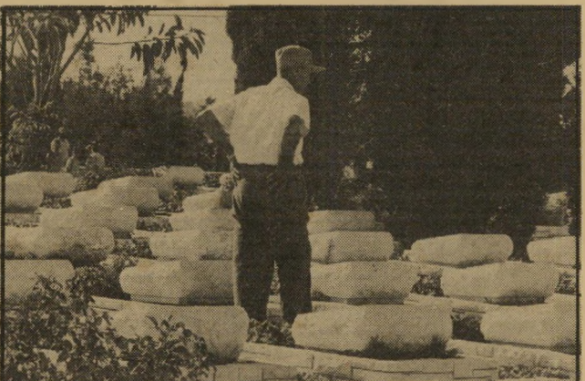
משה דיין בבית-קברות צבאי. ההפקות שלו הפילו קרוב ל-4000 חללים...

חוסר הביטחון הביתי, היחסים המתוחים בין האב והאם, הרג' שת-הבשל של בן המרגיש ש' לא מילא את הצפייות, העלבון שבעקבות הצוואה.