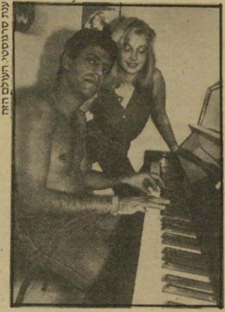
שימי ואשתו גניפור עצבים

בעיתון חדשות מופיעים מרי יום שישי ציטוטים קטנים של אנשים