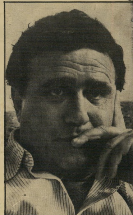
יהורם גאון חדשות לא מדוייקות