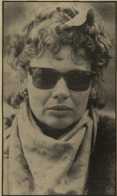
שחקנית ויפט ב.חנה ואחיותיה" אבל אין בעל

מספרים על וודי אלן שהוא שונא אנשים. זה פשוט לא נכון" היא מזרעקת. "הוא לבבי מאוד ואהב לשוחח. הוא רק ביישן גדול. לא יכול להיות