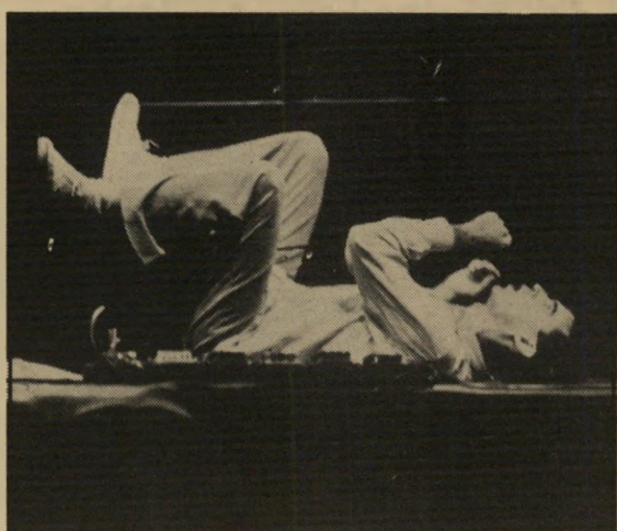
דייוויד בירן: קפדנות עילאית

גם להקשיב למילים, ומי שצורח ללא הפסק, נוסח מעריצי בוי ג'ורג' לדוגמה, יכול לשמוע רק את עצמו.