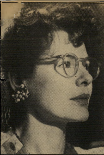
שחקנית ויפט בסרט "ימי הרדיו" רוצה ילד

לצלם הכל מחדש. כמה מן השחקנים, כולל סם שפארד, נאלצו לעזוב, כי היו להם התחייבויות אחרות. אבל מי שנשאר — כולל אותי, שעברתי באותה תקופה על מחזה חדש — עבר בפרך. וודי היה מבין וסבלן ושיחרר אותי לחזרות בכל יום אחרייהצהריים.