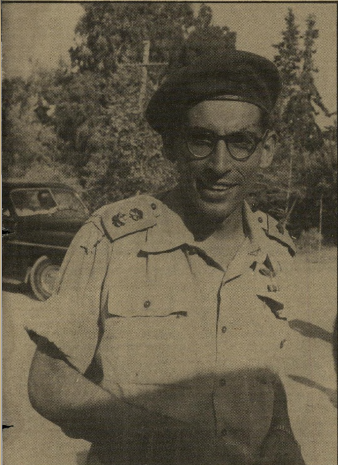
סגן-אלוף זאבי (1954) בגיפ של האו"ם, כמעט מילחמה

אנדרטה לטימטום לא בדאי להרגיז ררוזים. אנשי שמורות-הטבע לומדים זאת בדרך הקשה