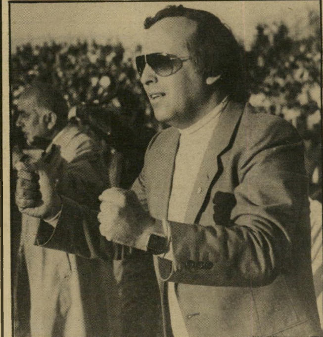
מנהל ויצנר האוהדים עשו את המוות

ככל הנראה לשחק בשורות הוהובים מהשכונה. חבל. ממן תרם הרבה לחיפה בתי-קופה ששיחק שם.